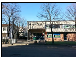
SCUOLA PRIMARIA "MADRE TERESA DI CALCUTTA"