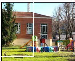
SCUOLA DELL'INFANZIA "DECIO RAGGI"