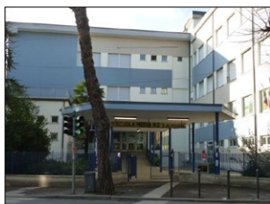
SCUOLA SECONDARIA DI PRIMO GRADO "DANTE ALIGHIERI"