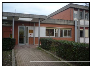
SCUOLA DELL'INFANZIA "CELLE"