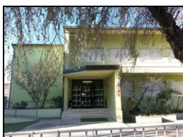
SCUOLA PRIMARIA "ANNA FRANK"