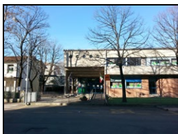
SCUOLA PRIMARIA "MADRE TERESA DI CALCUTTA"