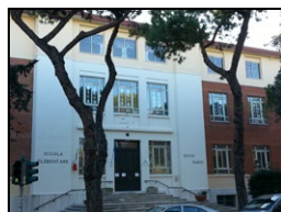
SCUOLA PRIMARIA "DECIO RAGGI"