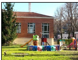
SCUOLA DELL'INFANZIA "DECIO RAGGI"