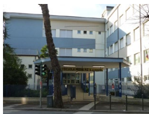
SCUOLA SECONDARIA DI PRIMO GRADO "DANTE ALIGHIERI"