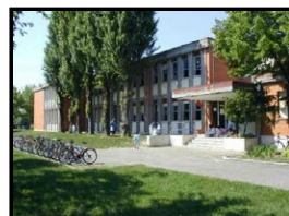
SCUOLA PRIMARIA "FEDERICO FELLINI"