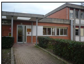
SCUOLA DELL'INFANZIA "CELLE"