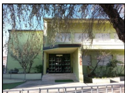
SCUOLA PRIMARIA "ANNA FRANK"